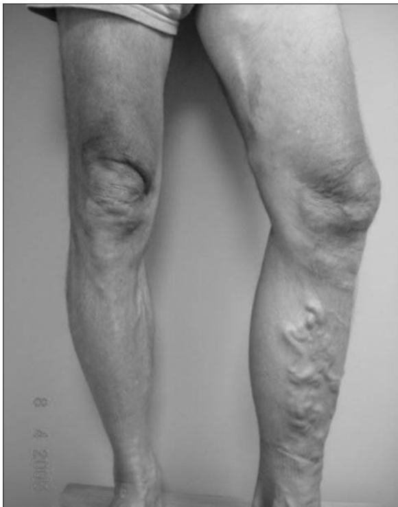
Figura 1: Paciente preoperatorio

Previamente al ingreso hospitalario el paciente es fotografiado y marcado con plumón de tinta oscura según los hallazgos clínicos y ecográficos, marcando golfos varicosos, venas varicosas de tipo colaterales y tributarias, recorridos safenos, ejes largos y perforantes (Fig. 1 y 2). Luego es hospitalizado en ayunas una hora antes del procedimiento. En sala de operaciones; se le monitoriza, se coloca una línea venosa periférica y se administra la anestesia que puede ser según el caso con neuroleptoanalgesia más anestesia local o con anestesia regional epidural; ésto se decide de acuerdo con la conveniencia de cada paciente y de acuerdo con la posible duración de la cirugía, si la cirugía es restringida a safena sin necesidad de trabajar en cayados y con golfos varicosos en pocos territorios; preferimos la anestesia local más sedación. Cuando el procedimiento requiere trabajar la unión safeno femoral o safeno poplíteo y los golfos varicosos están diseminados en ambos miembros; preferimos el bloqueo regional. Nosotros de rutina operamos los dos miembros inferiores en el mismo acto operatorio. Cabe resaltar que los bloqueos siempre son por períodos relativamente cortos, de manera que al concluir la cirugía el paciente deberá estar ya en condiciones de mover las piernas, pudiendo hacer los primeros ejercicios inmediatamente y estar en condiciones de alta hospitalaria dos horas después de