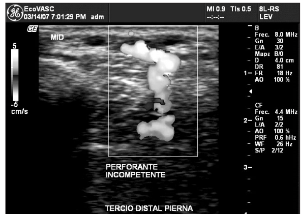
Figura 6: Perforante preoperatorio