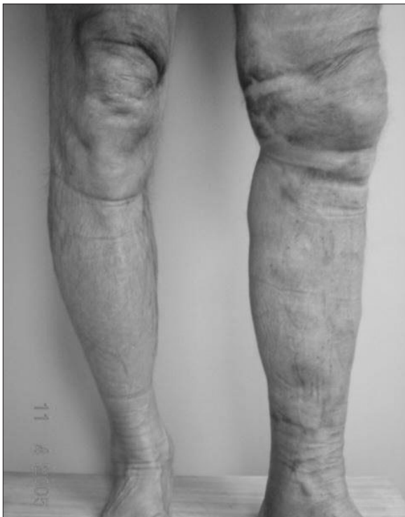
Figura 3: Post operatorio segundo día

En los casos que no se consigue el pasaje ascendente de la fibra óptica se puede optar por usar la vía retrograda desde la unión safeno femoral en dirección distal; en estos casos se requerirá de pasar un catéter guía y un introductor debido a la presencia de las válvulas y dada la rigidez de la fibra existe mucha facilidad de perforar la vena y terminar dañando tejidos aledaños. La técnica en los sectores de golfos varicosos por su propia naturaleza de gran irregularidad anatómica necesitan de múltiples punciones escalonadas ya que por sus propias tortuosidades, es imposible que la fibra óptica pase por todo su recorrido por punción única, por lo cual siempre con la técnica de Seldinger y con fibra de 400 \mu\text{m} , vamos realizando punciones progresivas, recuperamos sangre inmediatamente a cada punción y vamos introduciendo la fibra por cada sector y procedemos al laseado en forma secuencial en cada sector y siempre