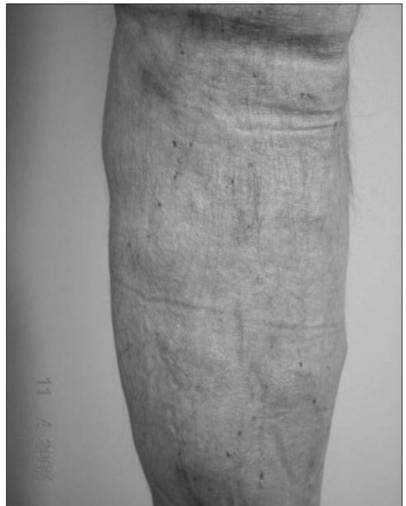
Figura 4: Post operatorio segundo día vista detallada