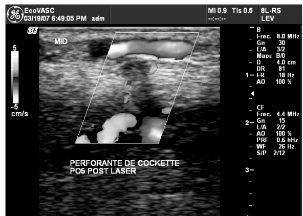
Figura 7: Perforante postoperatorio