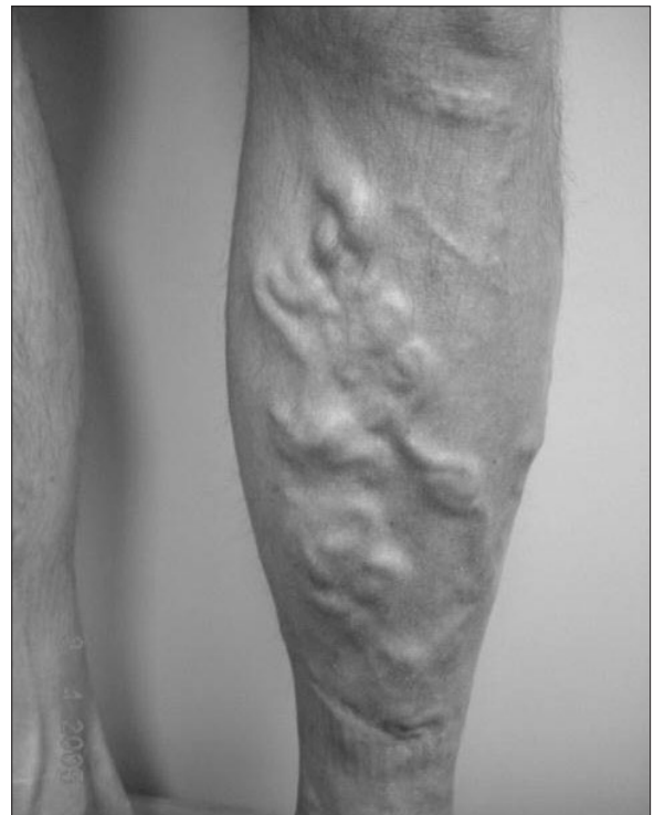
Figura 2: Paciente preoperatorio vista detallada