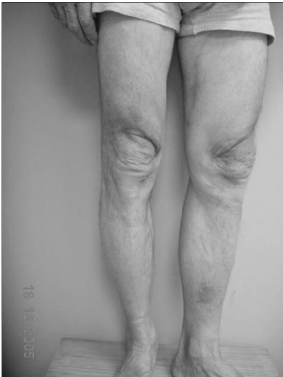
Figura 5: Paciente post operatorio tardío

Terminada la cirugía colocamos contención elástica con vendaje elástico o con media elástica de 20 a 30 mm/Hg, inmediatamente el paciente inicia suaves ejercicios, hasta estar en condiciones de caminar con seguridad y es dado de alta máximo dos a tres horas después de terminado el acto operatorio, pudiendo deambular desde el primer momento, realizamos control y curación al día siguiente y desde este momento nuestro paciente está totalmente listo para reincorporarse a sus rutinas habituales, la media de compresión graduada la deberá usar por cuatro semanas y de ser necesario, desde el quinto día de post operatorio inicia un ciclo de seis a ocho sesiones de terapia física, con el uso de ultrasonido y drenaje linfático como ayuda para disminuir la inflamación y acelerar la recuperación de las zonas de endurecimientos, propias del trabajo con láser, a las cuatro semanas los pacientes son nuevamente fotografiados (Figuras 3 y 5). Se realiza el seguimiento